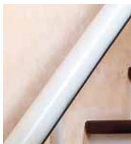
Avorio - colore di serie