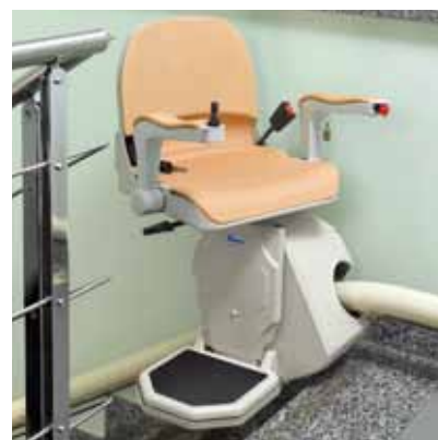
Rotazione del sedile per uno sbarco sempre agevole sul pianerottolo