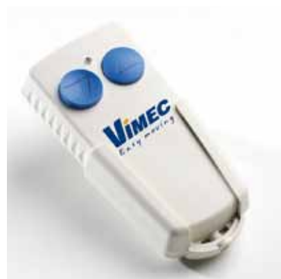
Telecomando di piano